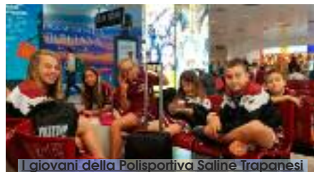
I giovani della Polisportiva Saline Trapanesi