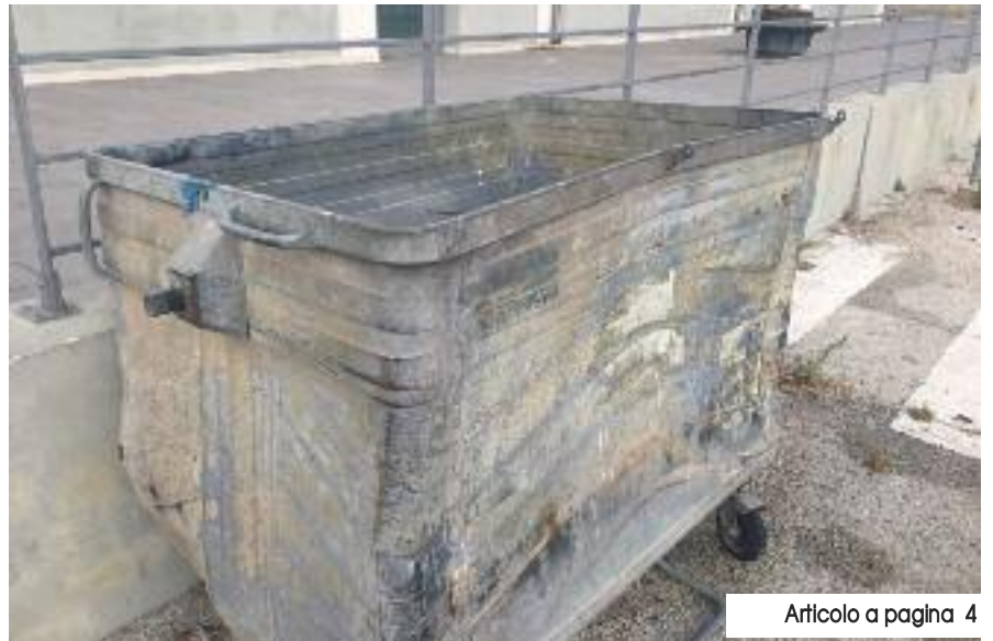
Articolo a pagina 4