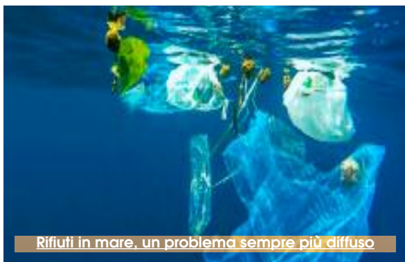
Rifiuti in mare, un problema sempre più diffuso

progetto prevede lo svolgimento di diverse attività oltre a partecipare alle «giornate di raccolta» (ciascuna della durata non inferiore alle cinque ore e secondo una turnazione che sarà stabilita) di «marine lit-