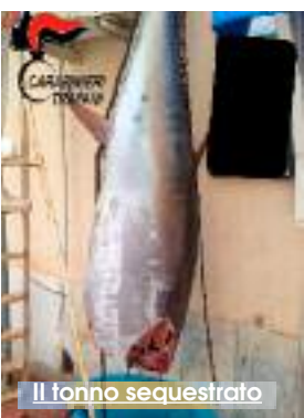
Il tonno sequestrato